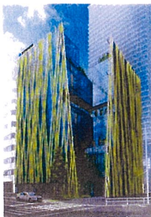
THE LINK SQUARE HEKIKAI